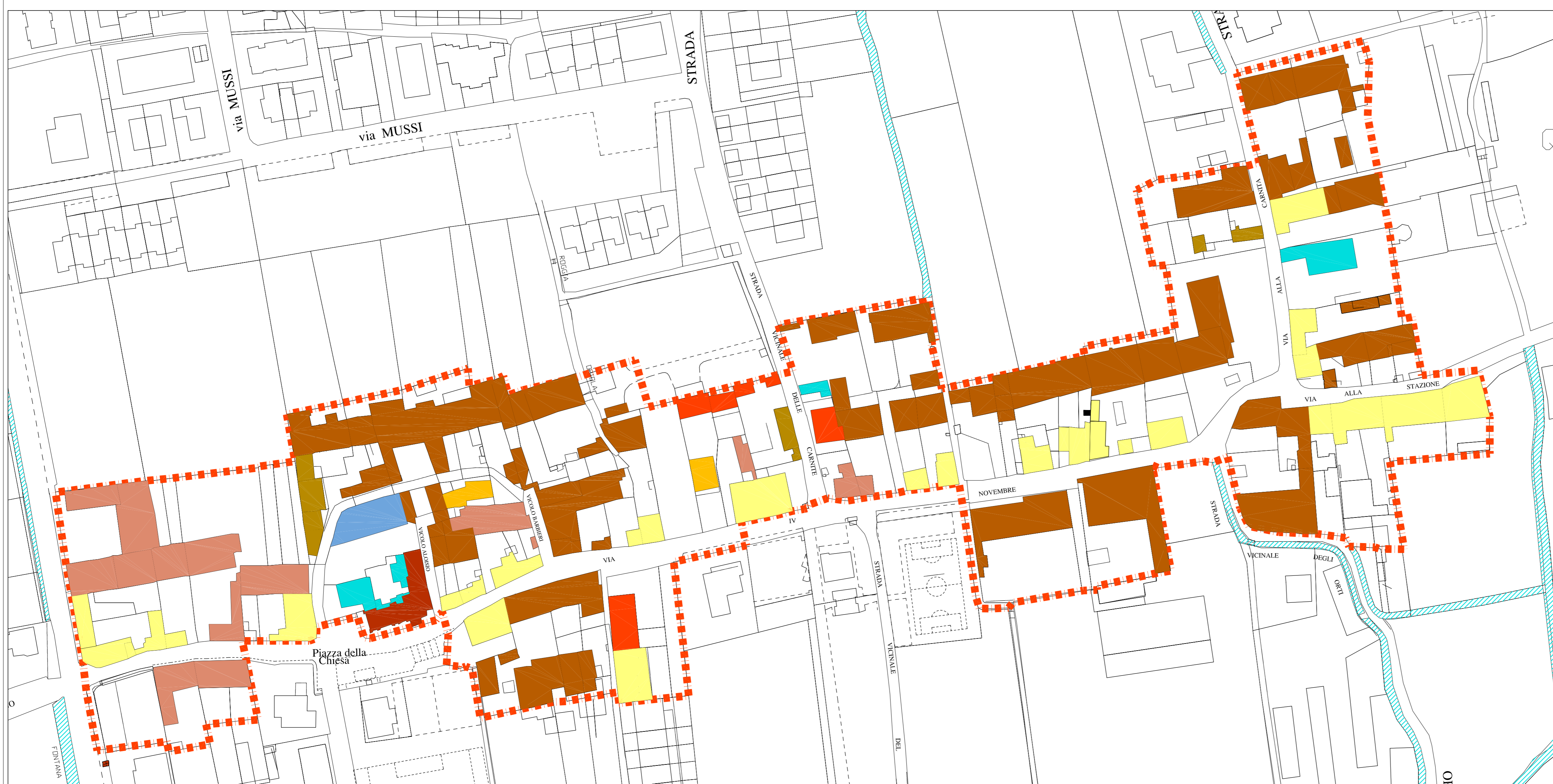
RIQUADRO B - tipologia edilizia